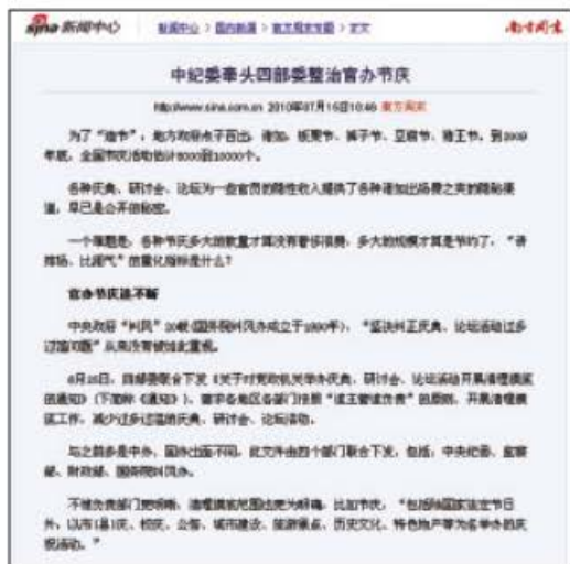
图1 中纪委牵头四部委整治官办节庆（网络截图） 资料来源： http://news.sina.com.cn/c/s1/2010-07-15/104620684359.shtml

海这样的直辖市，小到较小的行政区县，几乎都有节事活动，而且举办的数量和次数还有继续增加的趋势。这说明人们都已认识到举办节事活动能够带来的诸多效益。但是纵观中国目前举办的名目繁多的节事活动，尤其是与国外比较成功的节事活动相比，不难看到我国的节事活动品牌知名度低，举办届数短，能持续举办并发展成为国际节事活动的则更是凤毛麟角。目前中国高规格、大规模、高品位、高档次，并已经成为城市的形象工程和著名品牌的节事活动，仅有为数不多的几个，如1983~2010年已经成为举办28届的洛阳牡丹花会 ① ，自1989~2010年已连续举办22届的山东曲阜国际孔子文化节 ② ，自1985~2010年成功举办了26届的哈尔滨国际冰雪节 ③ 等。