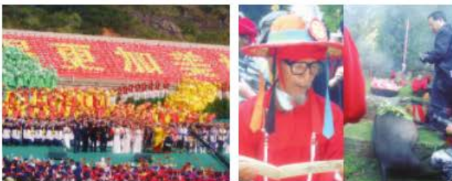
图4 云南丽江2003年第二届东巴文化艺术节的昆明市大型文艺表演