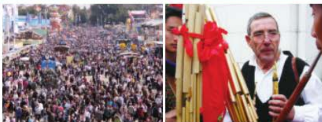
图6 慕尼黑啤酒节的盛大场面，该节（德语为Oktoberfest，即“十月节”，其英文官方网址为www.oktoberfest.de/en）每年9月末到10月初举行，是慕尼黑一年中最盛大的活动