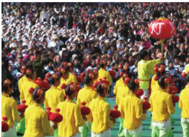
图9 2006年黄山国际旅游节开幕式现场，观众来自于学校、卫生、消防、公安、税务等机构，且都统一着装、集中安排坐席。当然，对那些希望尽快提高知名度的新兴旅游地以及那些期待解决季节性拥挤分流而在淡季组织节事活动的成熟旅游地而言，暂时的政府主导也是必要的。