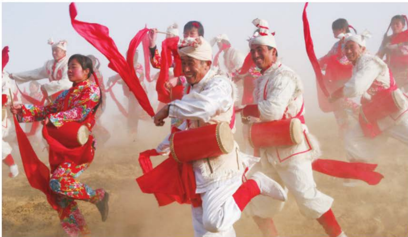
图8 延安安塞腰鼓（西河口）