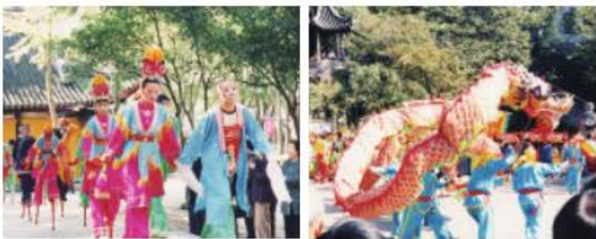
图2 苏州2000年11月虎丘庙会上的高跷队表演